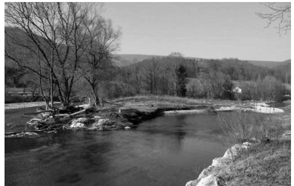
Zustand der Aue Februar 2008.