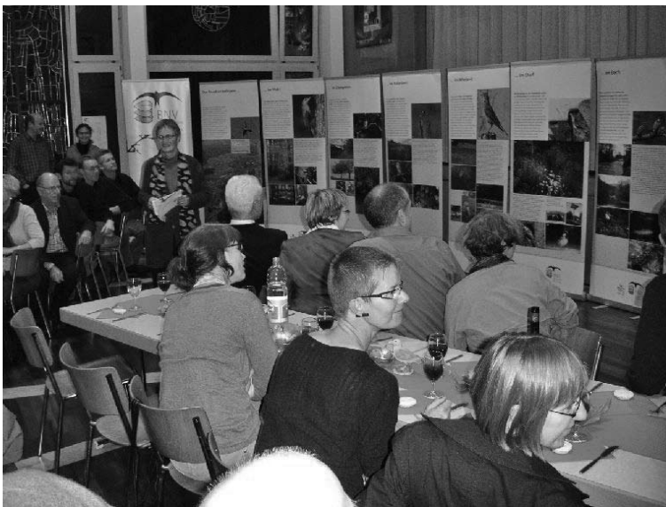
Die frisch enthüllte Ausstellung «Lebensräume im Baselbiet» sorgt bei den Gästen für grosses Staunen.