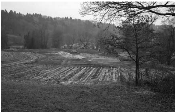
Baubeginn Dezember 2005.