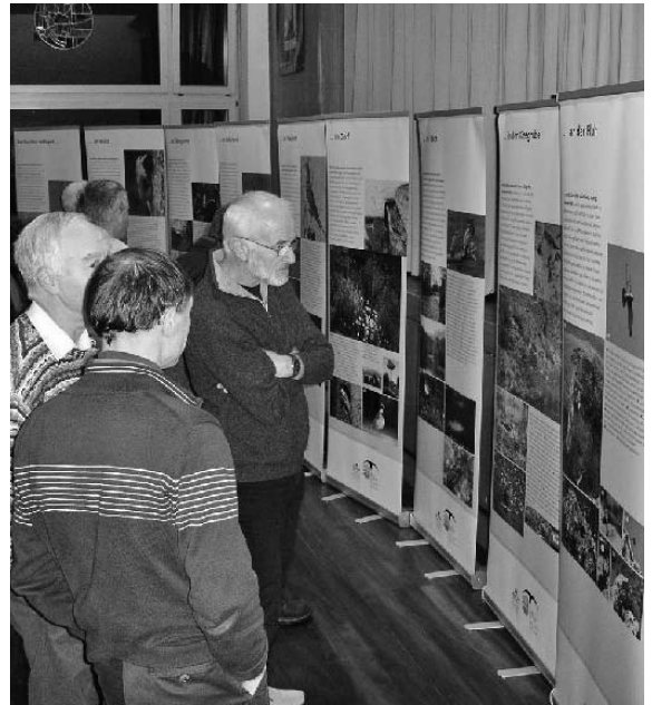
Aufmerksame Leser begutachten die attraktive Ausstellung über die Lebensräume unseres Kantons.